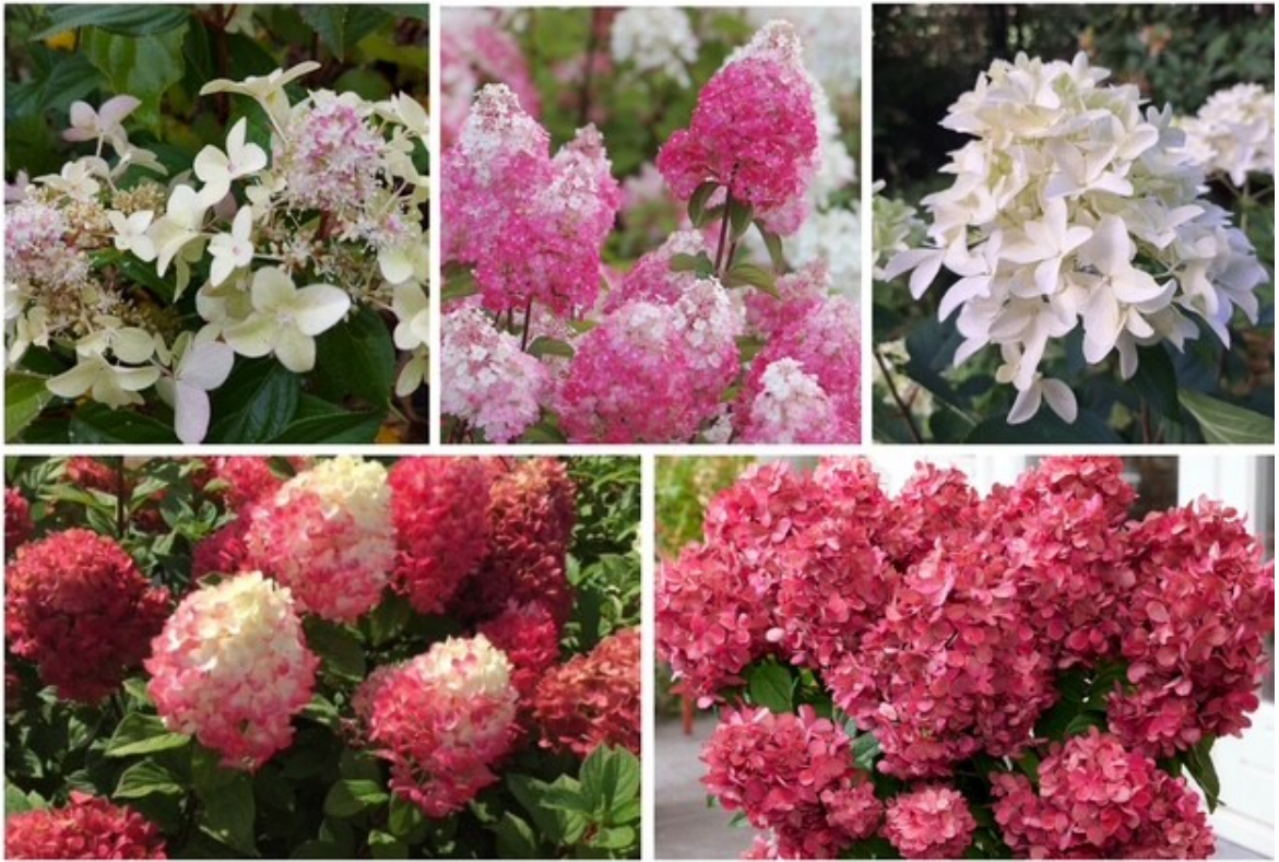
Bij de Hydrangea scandens (hybride): Runaway Bride , French Bolero en First love .